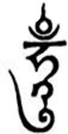
(黑面金母手印)。(藏文)：吽字