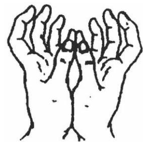
蓮花手印/捧寶珠印