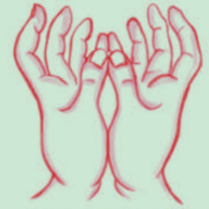
觀世音菩薩手印 Guān shì yīn pú sà shǒu yìn

zài dà qì zhōng xiāo shī jìn ér quán shēn chún bái tòu míng fā guāng dé dà qīng ān